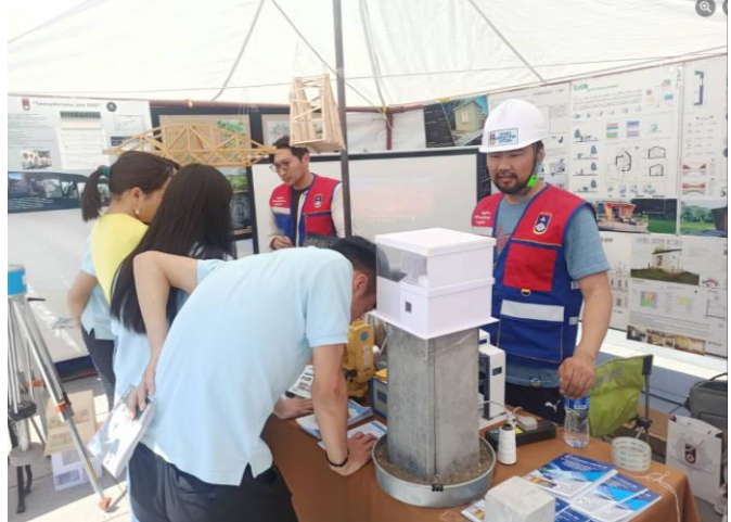
Өмнөговь аймаг. Даланзадгад хот "Ажнай" талбай Мэргэжил сурталчлах өдөрлөг