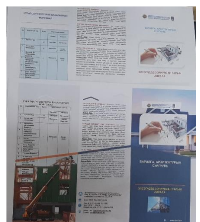
Мэргэжил сурталчилах брошюр, ном, товхимол